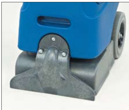
Le sabot de vacuum conçu avec la technologie d'écoulement en régime laminaire permet une meilleure récupération et séchage rapide.