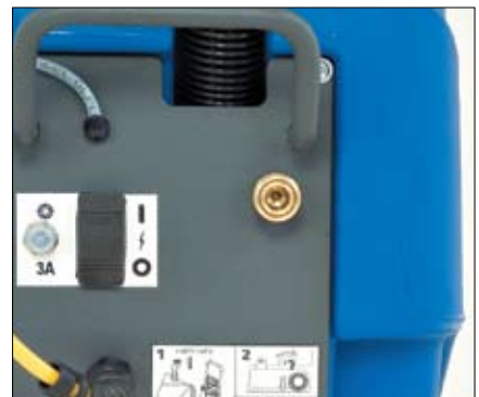
Les symboles universels du tableau de bord simplifient l'opération.