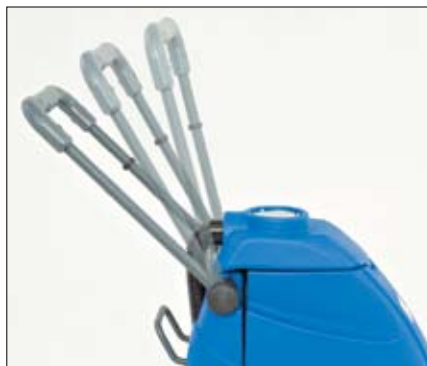
Poignée pliante pour un rangement et un transport faciles.